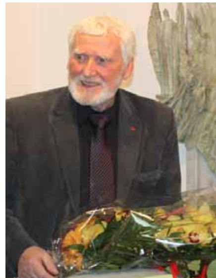
Tekst: Antoni Dobrowolski

Znakomity katalog wystawy wypełniony został pięknymi fotografiami artysty oraz wierszami Antoniego Dobrowolskiego – napisanych specjalnie na prośbę profesora.